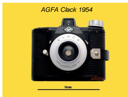
AGFA Clack 1954