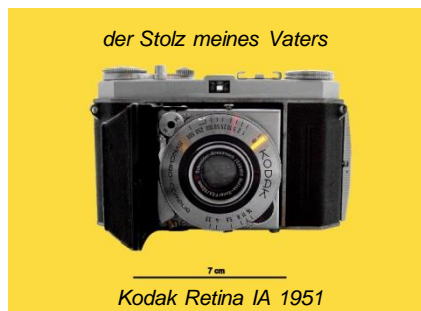
der Stolz meines Vaters