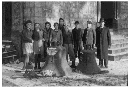
1941: erzwungene Abnahme der Glocken