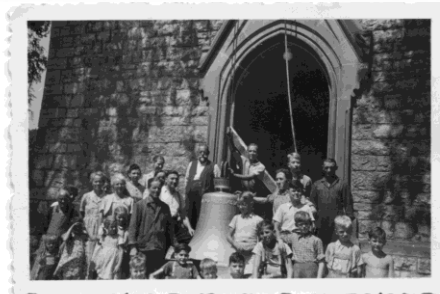
1952 neue Glocken, Foto von C.-A. Wolf

Eine zweite Bibel wurde der Wyhlener Gemeinde im Jahr 1927, als sie zur selbständigen Pfarrei erklärt wurde, von der Muttergemeinde Grenzach geschenkt. K. Paulus