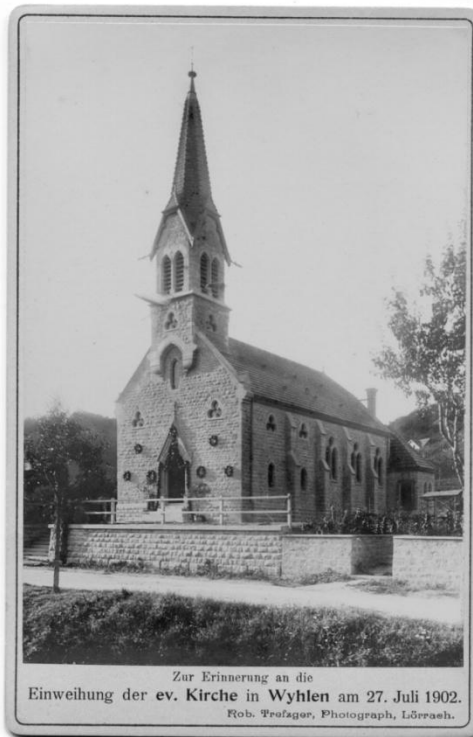
Zur Erinnerung an die Einweihung der ev. Kirche in Wyhlen am 27. Juli 1902.