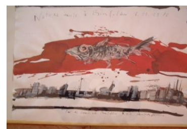
Nature morte à Birsfelden. 1.11.1986