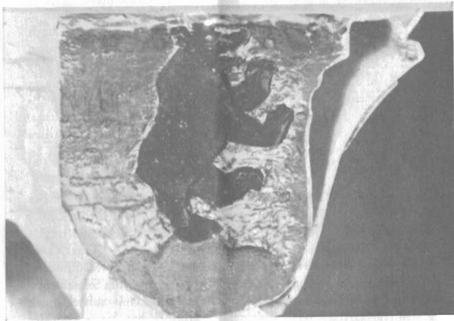
Bärenfelser Wappen aus der Kirche Schönau

Diese flüchtigen Angaben bedürfen der Berichtigung und Ergänzung. Die steinerne Figur des Ecce Homo (siehe, welch ein Mensch) wurde bei der Errichtung des Sakramentshäuschens angebracht. Es ist vollständig ausgeschlossen, daß nach 1556 das Sakramentshäuschen durch diese Figur bereichert worden wäre. Das 2. Wappen, das in den Kunstdenkmälern nicht bestimmt wird, hat die 3 Ringe des Wappens von Schönau-Wehr. Dieses Wappen löst die Frage der Stifter und die Zeit des Einbaues in die Chorwand. Ursula von und zu Schönau, gest. am 20. April 1552, war die Tochter des Hans Kaspar Hürus von und zu Schönau und der Anna Beatrix von Uttenheim. Adelberg (Albert) von Berenfels war der Sohn des Rudolf von Berenfels und der Ursula Münch von Wildperg. Adelberg und Ursula heirateten am 21. Juli 1494. Adelberg von Berenfels war 1497 auf dem Turnier zu Würzburg. Von diesem Adelberg hängt eine Wappenscheibe von 1513 im