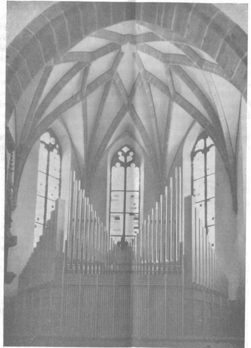
Chor der Kirche vor Aufstellung des Altars

„Dürfen wir überhaupt das Gotteshaus wesentlich verändern, wo es uns doch ein Zeichen der Beständigkeit unseres kirchlichen Glaubens ist gegenüber dem raschen Wechsel aller Einzelschicksale?“ ist eine der