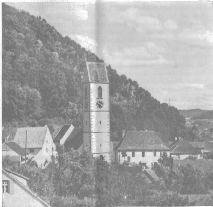
Ansicht der Kirche und des Pfarrhauses

opfernden und selten liebevollen Sorge der Kirchenältesten um Fortschreiten und Gelingen des Baues, in der Teilnahme der Gemeinde, die vielfach aus anfänglichen Zweifeln zu sichtbaren Zeichen ihrer Anerkennung fortschritt, — wenn aus alledem die lebendigen Bausteine erwachsen sind, deren der Bau einer Kirchengemeinde immer von neuem bedarf, so ist das nicht zuletzt der Gnade zuzuschreiben, die einst hier durch die Hand eines tüchtigen Baumeisters schöpferische, lebendige Form entstehen ließ.