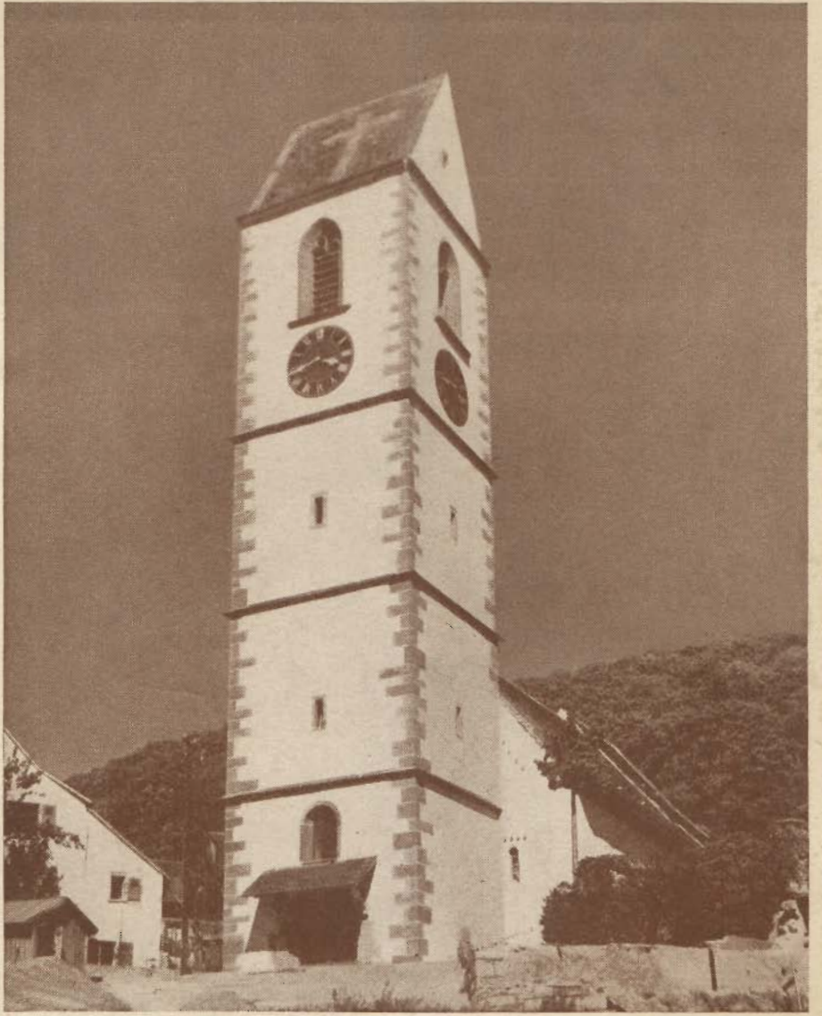
Kirche zu Grenzach